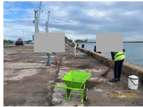
ภาพที่ 2.2-5 การเก็บกวาดทำความสะอาดพื้นที่ท่าเรือ หลังขนถ่ายสินค้า