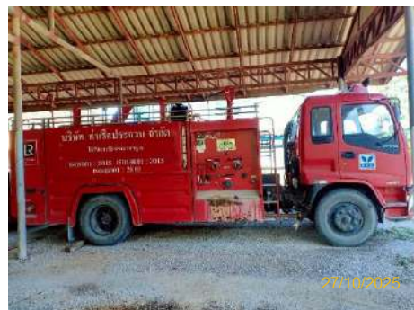
รถดับเพลิง