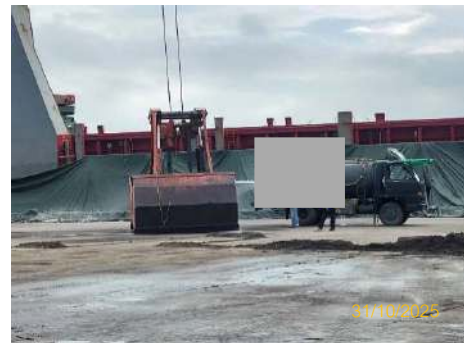
ภาพที่ 2.2-15 การปิดคลุมกองสินค้า/การฉีดพรมน้ำ