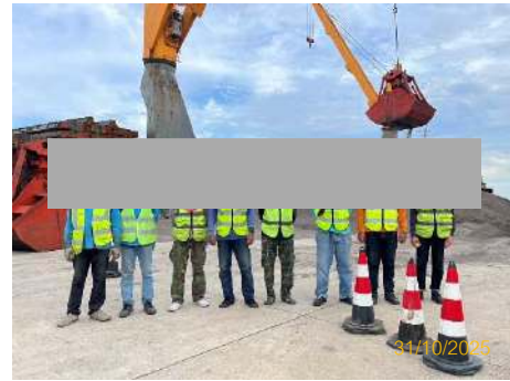
ภาพที่ 2.2-12 พนักงานใส่อุปกรณ์ป้องกันอันตรายส่วนบุคคล