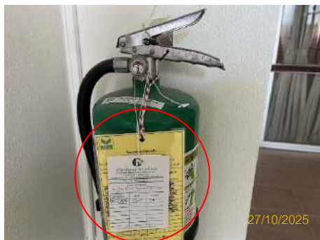
ภาพที่ 2.2-40 อุปกรณ์ป้องกันและระงับอัคคีภัย