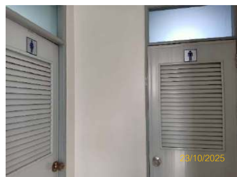
ภาพที่ 2.2-3 ห้องน้ำที่อาคารปฏิบัติงาน