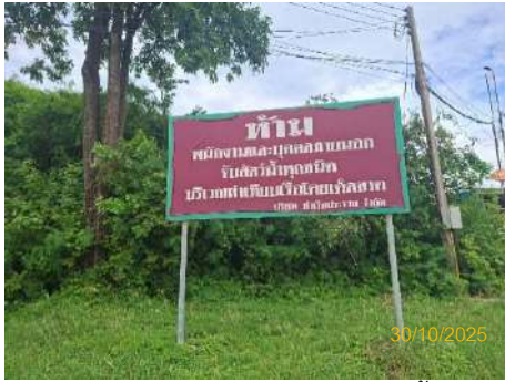
ภาพที่ 2.2-16 ป้ายห้ามจับสัตว์น้ำ