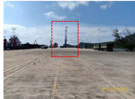
ภาพที่ 2.2-18 ปั่นจั่น/เครนบนท่า