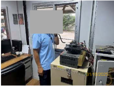
ภาพที่ 2.2-31 ระบบวิทยุสื่อสาร