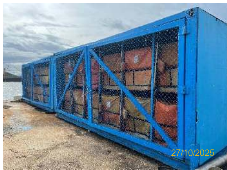
ภาพที่ 2.2-6 ตู้กักน้ำมัน