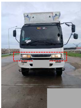
ภาพที่ 2.2-27 สัญญาณไฟกระพริบของรถบรรทุก