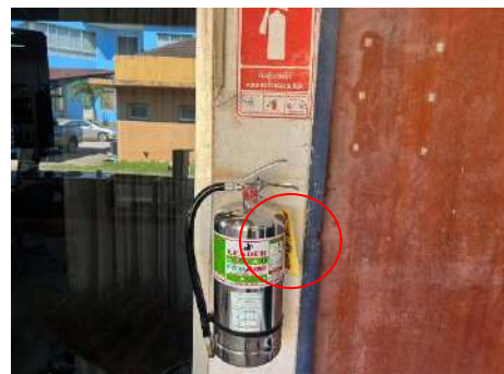
ภาพที่ 2.2-41 การตรวจสอบสภาพอุปกรณ์ดับเพลิงโดยบริษัทผู้จำหน่าย