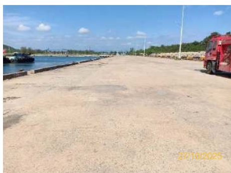
ภาพที่ 2.2-10 พื้นที่กองสินค้าเทกอง