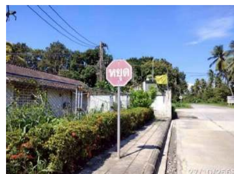
ภาพที่ 2.2-20 ป้ายสัญลักษณ์จราจร