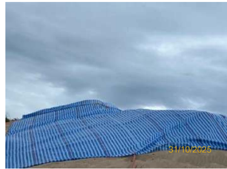
ภาพที่ 2.2-13 บริเวณลานสำหรับกองเก็บกลุ่มแร่ในเขตพื้นที่ทำเรือ และร่องระบายน้ำพื้นที่เก็บกอง