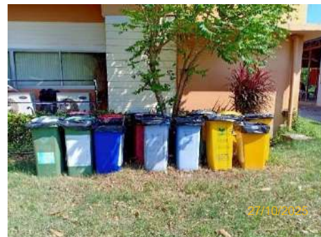
ภาพที่ 2.2-7 ถังขยะภายในโครงการ แยกประเภท