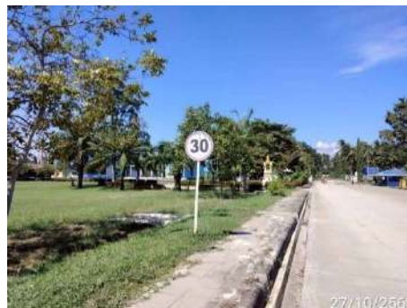
ภาพที่ 2.2-19 ป้ายจำกัดความเร็ว