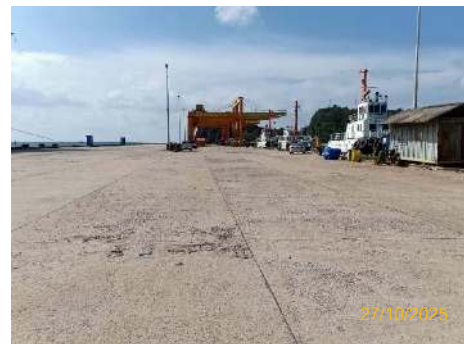
ภาพที่ 2.2-2 บริเวณพื้นที่ท่าเรือ