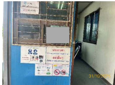
ภาพที่ 2.2-38 ป้ายบอก/ป้ายเตือน