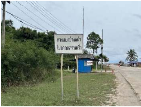
ภาพที่ 2.2-21 ป้ายเตือนลดความเร็ว บริเวณทางรถวิ่งเข้า-ออกโครงการ