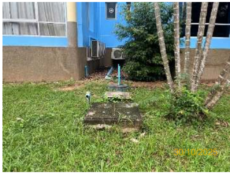
ภาพที่ 2.2-4 บ่อเกรอะ-บ่อซึม และถังกรองไร้อากาศ ที่อาคารปฏิบัติงาน