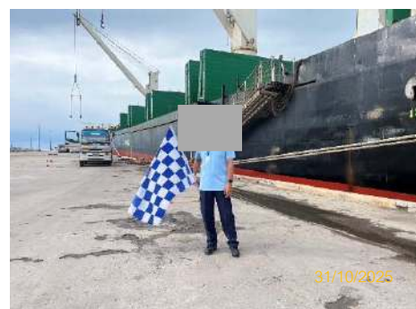
ภาพที่ 2.2-30 พนักงานควบคุมการจราจร ประจำท่าเทียบเรือ