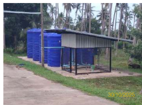
ภาพที่ 2.2-11 บ่อบาดาลใช้ประโยชน์ในบริเวณหน้าท่า และรดน้ำต้นไม้