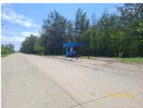
ภาพที่ 2.2-29 พื้นที่ซังน้ำหนักรถบรรทุก