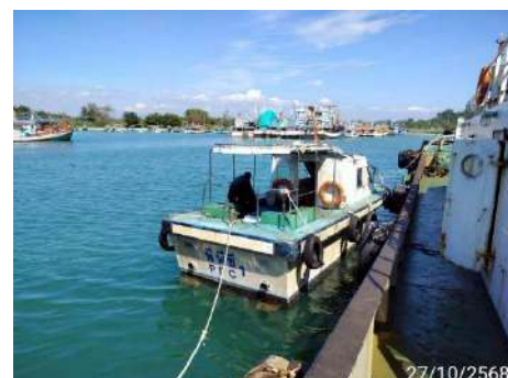
ภาพที่ 2.2-36 เรือเร็ว