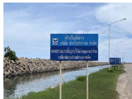
ภาพที่ 2.2-28 ป้ายแสดงเขตพื้นที่ท่าเรือ