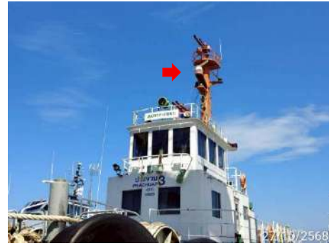
ภาพที่ 2.2-37 เรือดับเพลิง