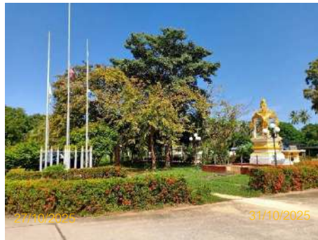
ภาพที่ 2.2-1 พื้นที่สีเขียว