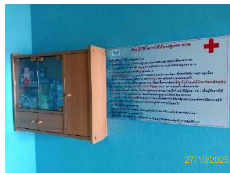
ภาพที่ 2.2-42 ตู้ยาสามัญประจำบ้าน