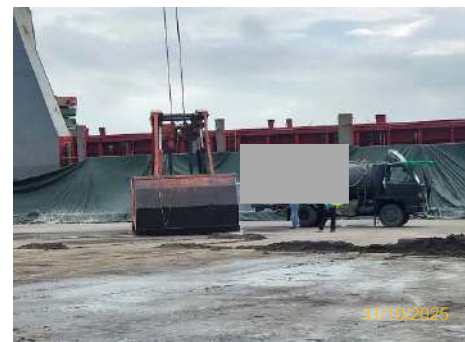
ภาพที่ 2.2-9 การชิงผ้าใบระหว่างเรือสินค้ากับหน้าท่า