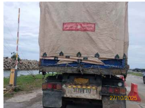
ภาพที่ 2.2-14 การปิดคลุมกระบะท้ายรถบรรทุกด้วยผ้าใบและรัดตรึงสินค้า