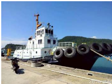
ภาพที่ 2.2-33 เรือ Tug