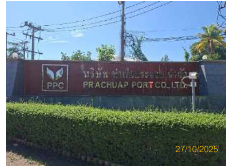
ภาพที่ 2.2-22 ป้ายชื่อหน้าโครงการ