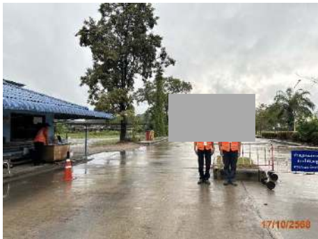
ภาพที่ 2.2-24 ป้อมยามรักษาการณ์