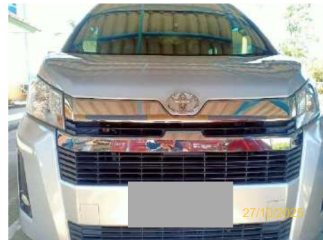
ภาพที่ 2.2-44 รถรับส่งผู้ป่วยไปสถานพยาบาล