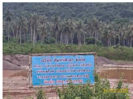
ภาพที่ 2.2-39 ป้ายบ่งบอกสินค้า สถานะของการปฏิบัติงาน และขอบเขตพื้นที่ในขณะปฏิบัติงาน