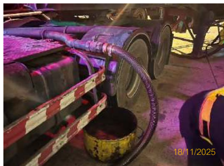
ภาพที่ 2.2-8 ถาดรองน้ำมันบริเวณข้อต่อ