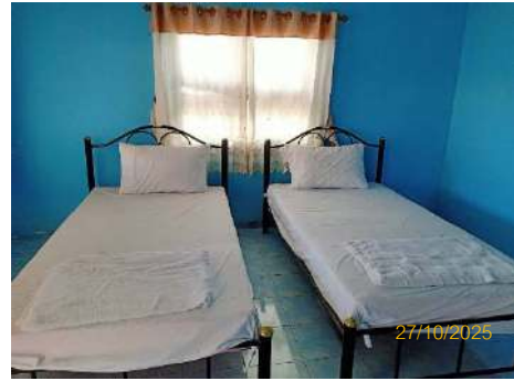
ภาพที่ 2.2-43 ห้องปฐมพยาบาล