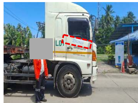
ภาพที่ 2.2-26 ป้ายแสดงหมายเลขโทรศัพท์ที่รถบรรทุก