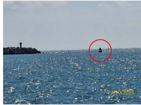
ภาพที่ 2.2-32 พุ่มสัญญาณไฟนำร่อง