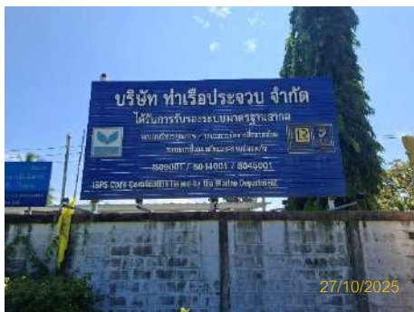
ภาพที่ 2.2-25 ป้ายแจ้งช่องทางร้องเรียนปัญหาจราจร