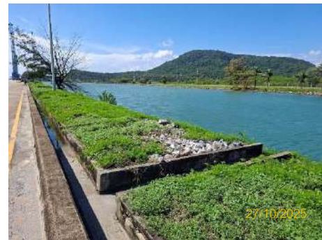
ภาพที่ 2.2-34 ระบบวางระบายน้ำจากกิจกรรมล้างทำ ความสะอาดพื้นที่ท่าเรือ