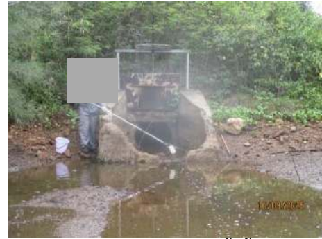
ภาพที่ 2.2-17 บ่อพักน้ำทิ้ง