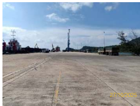
ภาพที่ 2.2-35 Mobile Crane